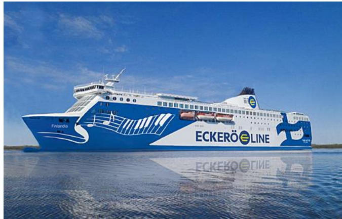
Laiva on Eckerö/ Finlandia M/S.